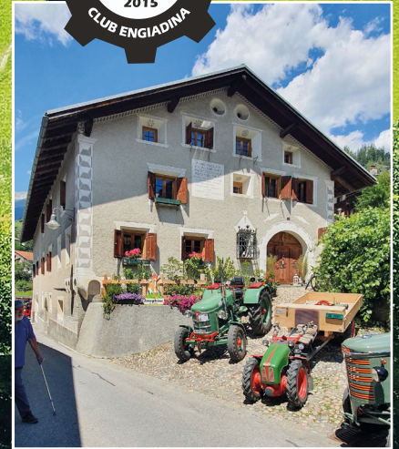
Oldies in Filisur, mit Engadinerhaus.

Am ersten Wochenende im Juli trafen sich über 50 Oldtimer im kleinen, beschaulichen Bergdorf, um gemeinsam zu feiern und Zeit zu verbringen. Die Almatraker Mittelbünden riefen und die Oldies kamen aus nah und fern, vom Engadin, Bündner Oberland, Liechtenstein und der Ostschweiz.