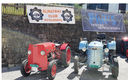
Ausstellung in Filisur.

Die Engadiner machten sich auf den Heimweg, dafür reisten am Sonntag andere an, sodass wieder über 50 Fahrzeuge