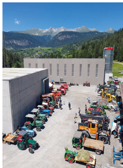
Ein Teil der Fahrzeuge vom Samstag.

anwesend waren, von alten Traktoren über Transporter, Jeeps und sogar je ein Auto- und ein Motorrad waren mit von der Partie.